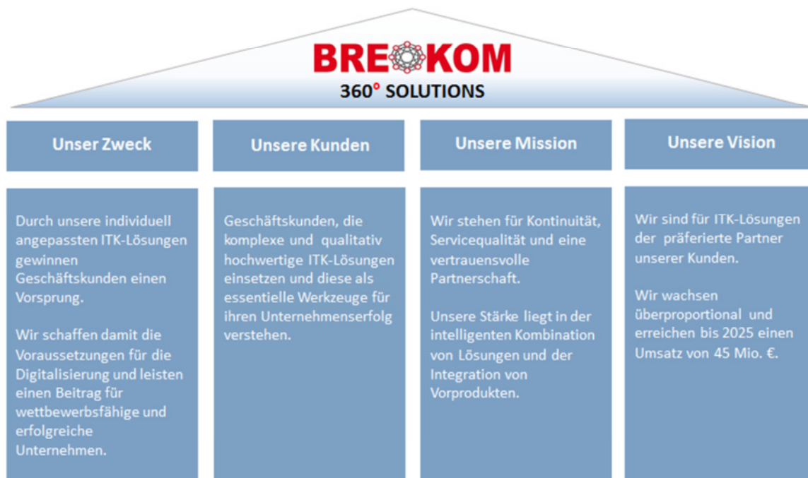
Abbildung 2: Mission und Vision

Strategie spielt für BREKOM eine zentrale und wichtige Rolle. Die Strategie soll BREKOM auf Stärken und Marktchancen ausrichten und eine Leitplanke für unser zukünftiges gemeinsames Handeln sein. Unsere Unternehmenssituation und die Unternehmensstrategie unterziehen wir regelmäßig einer eingehenden Analyse und entwickeln hieraus Rahmenbedingungen für unser zukünftiges Handeln.